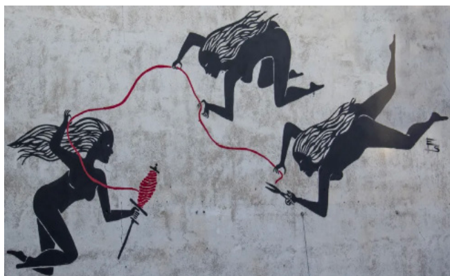
Grafiti d'Ermisenda Soy (Fàbrica Roca Umbert, Granollers)

En la mateixa situació, per quina norna us decantaríeu? Veieu possible alguna altra posició?