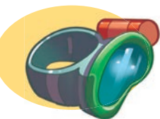
ULLERES PER A ULTRAVISIÓ SUBAQUÀTICA