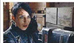
►► Noomi Rapace, la Lisbeth de la trilogia cinematogràfica sueca.