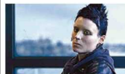
►► Rooney Mara encarna Lisbeth en el film de Fincher.

► A Suècia de seguida van ensumar el filó: tres films, un per novel·la, dirigits per Niels Arden Oplev i Daniel Alfredson i protagonitzats per Noomi Rapace fent de Lisbeth Salander i Michael Nyqvist. Un milió i mig d'espectadors a Espanya va veure la primera entrega, que va recaptar més de nou milions d'euros. El mateix equip va rodar